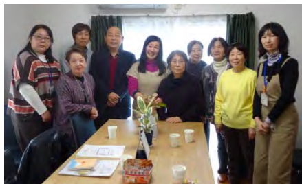
スタッフのみなさん

利用料金は一回一時間一〇〇円で買い物や散歩の支援を行います。「ゴミ出しは週一回一〇〇円となっています。このような支援は「訪問型住民主体サービス」と呼ばれ、運営には市の補助金も受けられ、スタッフは「そがみほらわあいハートポイント」が受けられます。