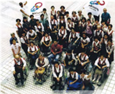
平成8年9月「東京Ours」参加 都庁前広場

例会は、原則として第三日曜日ですが、公民... 館の都合で変わることがあります。