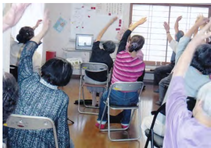
ビデオを見ながら百歳体操...80歳代とは思えない元気ぶり！

お茶わんやテーブルを片付けた後、ビデオを見ながら百歳体操腕や足にベルトを巻き付けて負荷をつけた体操もあり、筋力をつけ足腰が鍛えられるように工夫された体操だ。