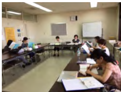
皆んなで朗読しています

「あめなほ あかいな・・・」とひとひら順番に朗読。「あめなほ あかいな・・・」とひとひら順番に朗読。「あめなほ あかいな・・・」とひとひら順番に朗読。アクセント辞典を取り出して鼻濁音のチェック。注意すべき発音として、鼻音化・無声化・長音化があらう鼻濁音についての指導。