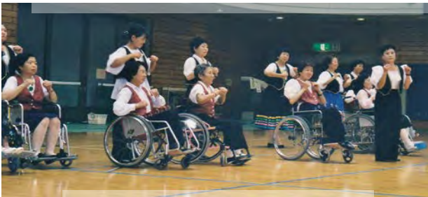
平成11年9月横浜ラポールの祭典