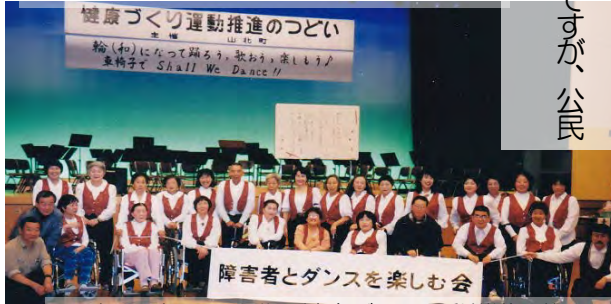
平成11年1月山北町健康づくり運動推進の集い