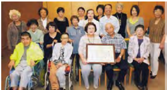
市政功勞表彰を祝しての集い