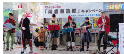
なじみのある曲で、聞きられました