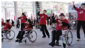
踊る方も見る方も楽しく

支援学校の7名の先生方による「銀河に踊っていた」。 2番目に登場したのは、相模原中央