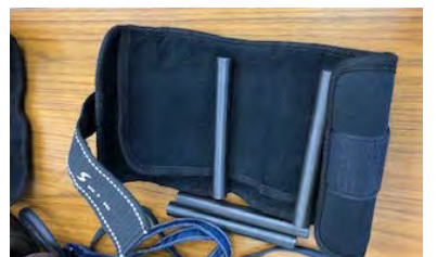
重錘バンド (重りが片方最大10本ずつ入る)