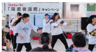
若者のダンスはキュート！

3番目の相模合同チーム(踊り屋MIX・そつ舞龍・笑楽)によるよさこいソーランのエネルギー溢る踊りは、天井まで届くほどの大きなフラッグが振られ勢いを添えると、踊りは一層迫力を増し、いやがおうにも通る人の足を止めていた。